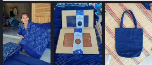
ผ้าถุงย้อมคราม